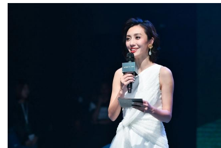
主持人开场-天悦湾项目推介