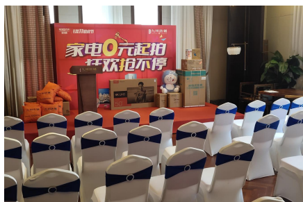
入座等待参与一元竞拍