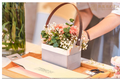
拍卖会结束-插花活动开始