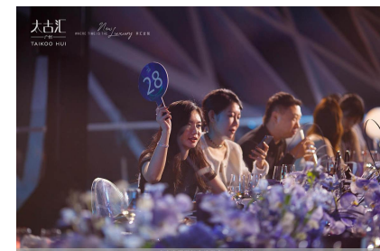
第一次拍品展示，买家进行喊价竞拍，价高者得，三次落锤